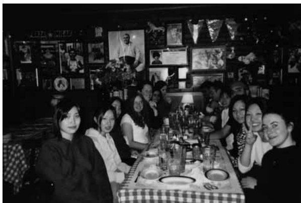
図3 Thomas More College