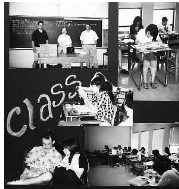
図2 Thomas More College