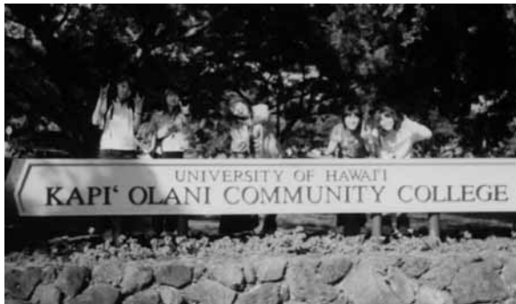
図5 Kapiolani Community College