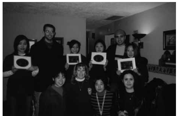
図4 Thomas More College