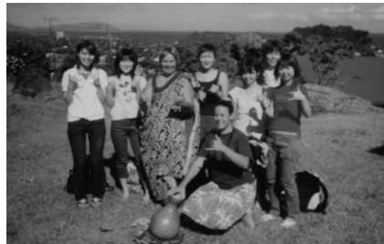
図6 Kapiolani Community College