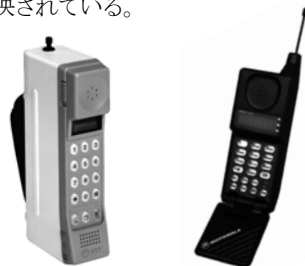
図2 TZ-802b 型と MicroTAC

「TZ-802 型」が家庭用電話機の形状を有しているのに対し、「MicroTAC」は、現在の携帯電話の形状に相似しており、フリップ型が採用されている。これはボタン等を隠した端正な外観と、収納時の誤操作防止、利用時の集音性向上の役割を同時に併せ持つ形状としての解であり、製品の機能美が形状に上手く反映されている。