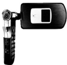
図3 P900iV(動画撮影スタイル)

付帯機能の増加はさらに携帯の形を変えていくことになる。1999年にDDIポケットからカメラ機能、2001年にNTTDoCoMoから動画撮影機能、2006年にau by KDDIからデジタルテレビ機能(ワンセグテレビ)まで付帯機能として、携帯電話と融合していく。カメラやビデオ、デジタルテレビ、これらのデバイスやメディアは独自のインターフェイスを持つのだが、携帯電話と一体化したことにより独自の形状をもつことになった。