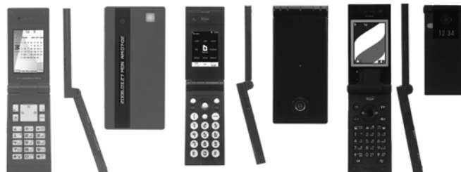
図6 左から N702iD・SH702iD・P702iD

っていたかのように見受けられた。そのため、それぞれの記者発表時においても使いやすさに関することはあまり言及していない。そのためか「F702iD」を除く機種の形状は、シンプルな直方体である。また、au design project が行っている、コンセプトモデルを発表し、市場の声を反映させて市販化するプロセスは、デザインへの注目が高い自動車と同様であり、携帯電話へのデザイン意識を高めている。