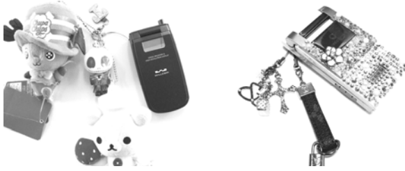
図7 デコレーションされた「ケータイ」

それぞれ自分の形状を作りだし、自分の分身として「ケータイ」を肌身離さず持ち歩く。色々な機能を付帯した「ケータイ」は、それ一つで様々な娯楽やコミュニケーションを提供し、仮想的には社会と繋がるのが可能である。現在子どもにも携帯電話を持たせている家庭が増加した。2007年度内閣府の調査では、小学6年生で3割以上、高校生に至っては95%以上携帯電話を所持している。現在、市場も子ども向けの携帯電話に注視しており、子ども向けの携帯電話には所在地が分かるようにGPSが搭載されていたり、危険を知らせるブザーがついていたり、独特の機能がついていることが多い。逆に一目で子ども用とわかるフォルムを持っており、それを避ける子どもも多い。