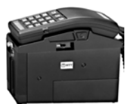
図1 ショルダーホン

1985 年、NTT は屋外でも使用可能なポータブル電話機「ショルダーホン 100 型」を発表した。携帯電話の歴史について、歴史上のどこを最初とするかは議論があるが、人が持ち運ぶことが可能となったこの機種を起点とする。