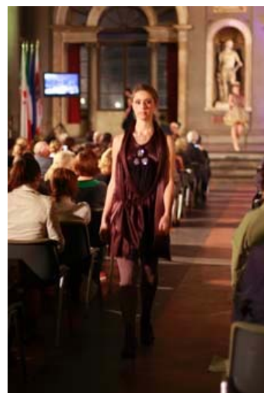
写真18 本学学生の作品

のままに表現しようとする学生の感性のぶつかり合いが見られ、興味深かった。事業後の本学参加学生に対する聞き取り調査では、作品全体のバランス、細かな縫製テクニックの面で非常に参考になったと感じている半面、デザインに関わる色のコーディネート、アクセントに入れ方、学生のコンセプトをどう表現するかという点においては、一致点が見出せないことのほうが多かったようである。それぞれがデザイナーであるという点で、それぞれの意見を主張しあうのは当然のことである。写真1から写真4は、制作指導会の模様を示している。