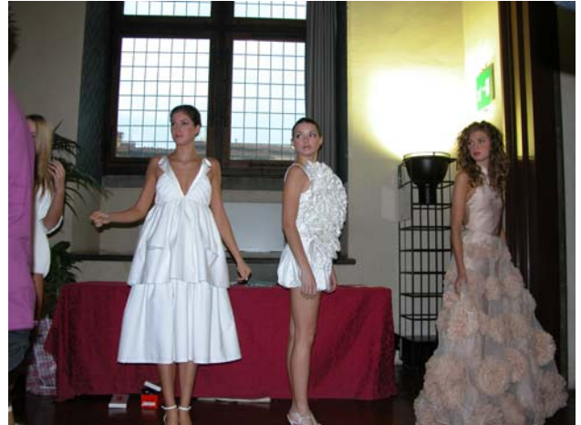
写真10 ポリモーダの作品を着た開演間近のモデルたち