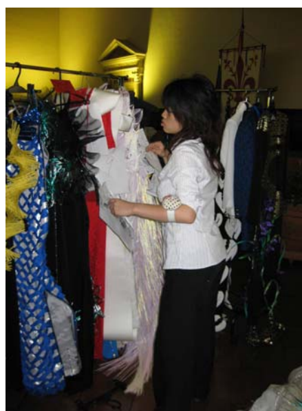
写真8 学生作品のショーに続くNDK会員のショーに向け衣装の最終チェックをする本学学生

れた公園(ヴィラ・ストロツィ)の中に本部、図書館、講義室などがある他、やや離れた場所に制作スタジオ(実習教室)がある。学生数は、約800名、教員数は約90名で、ほとんどが業界で活躍するデザイナーや、フィレンツェ大学の教授陣である。現在の校長は、長くアントワープ王立アカデミー・ファッション科の責任者だったリンダ・ロップパ氏で、2007年1月に就任し、ますます注目を集めている。