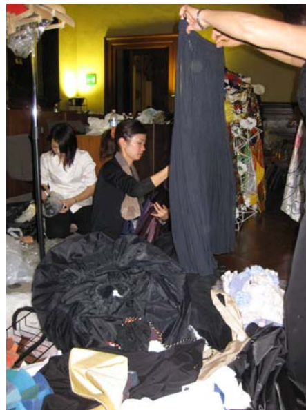
写真12 ファッションショーが終了し、衣装の後片付けをする本学学生

テーマは、『RE-BORN よみがえる』とし、「 ふる 故きを たず 温ねて新しきを知る」という言葉にあるように、ファッションの最先端を目指す若者が、現代社会の中に息づく伝統の美しさや、古の美しさの中に新しさを見出して、それをファッションデザインで表現することをコンセプトとした。