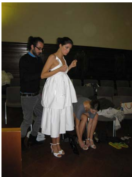
写真5 モデルフィッティングのポリモーダ学生