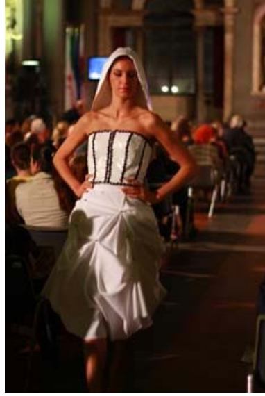
写真20 本学学生の作品