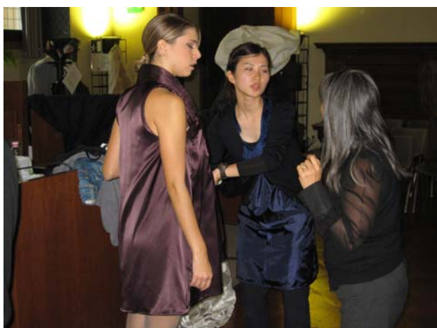
写真7 制作者(本学学生)とモデルが通訳を介してウォーキングなどの確認をした