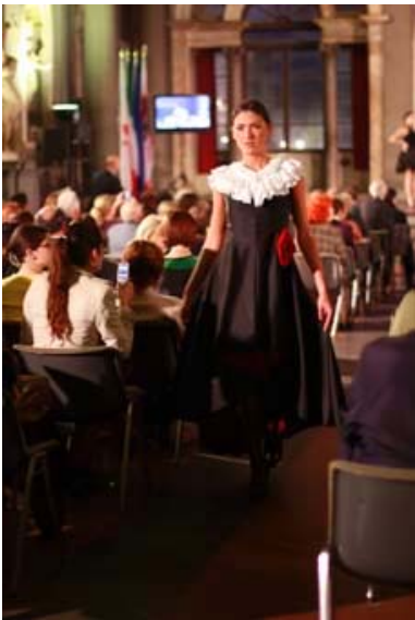
写真22 本学学生の作品