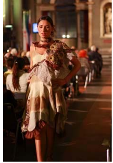
写真21 本学学生の作品