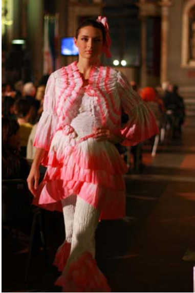
写真19 本学学生の作品