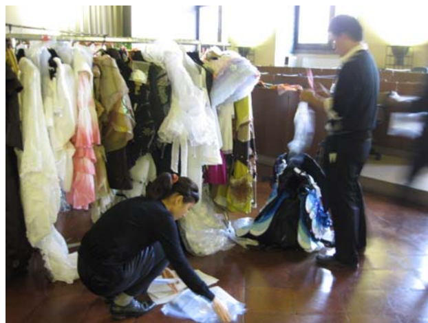
写真6 衣装、付属品等を確認しモデルフィッティングに備える