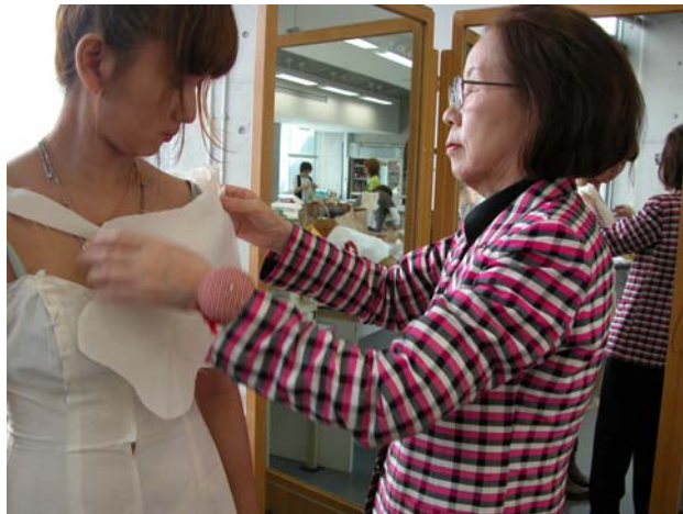
写真4 本学での指導会の様子(2) トルソーにシティングを組み立てていくばかりでなく、実際に着用してシルエットの検討をする本学学生とNDK会員デザイナー

街でもある。このように、フィレンツェは、ファッションにおける最新のトレンドとヨーロッパの歴史の深さを体感できる数少ない街のひとつである。一方、ヨーロッパでは、19世紀末からの日本の絵画、工芸、建築室内装飾、モードにおける「ジャポニズム」の影響や、20世紀初頭に川上貞奴らによって紹介された「キモノ」をはじめとした、日本の伝統文化に対する熱いまなざしは現在も衰えていない 9) 。このような街で、ルネサンス以後の芸術文化の潮流と最新のファッショントレンドを肌で感じ、そこに学ぶ学生とファッションの作品を通して交流し、同じ目的に向かって意見を交わす機会は、次世代のファッション産業を担う若者にとっては、またとない貴重な経験となる。また、この事業を岐阜県で企画することで、当地における人材育成の大きな力となることが期待される。