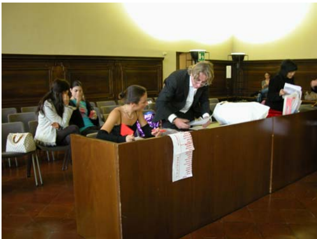
写真11 ファッションショーの演出を担当したスタッフと助手が順番を確認した