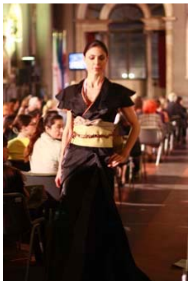
写真14 本学学生の作品