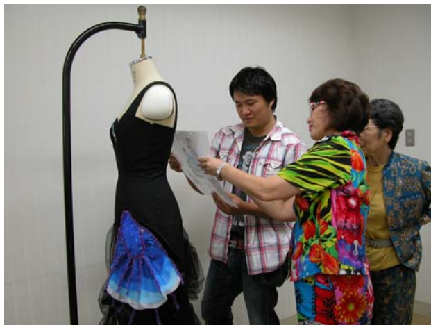
写真2 第1回指導会の様子(2) 既に基本シルエットの完成に近い学生に、デザイン画を見ながらアドバイスするNDK会員デザイナー