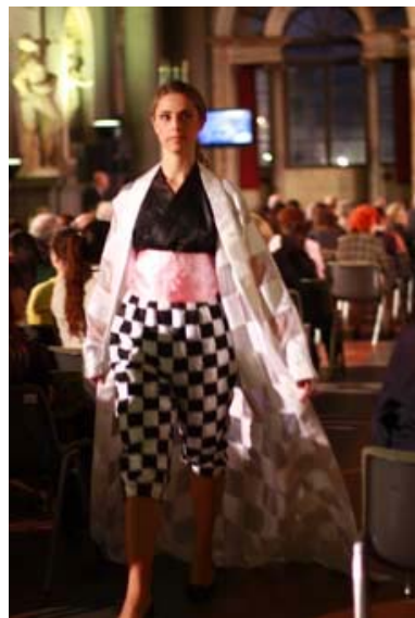
写真23 本学学生の作品

ら6名と筆者が、日本人通訳3名を介して出演順と衣装の照合を行った(写真5から写真12)。写真9において、右の女性が持っているカードに、モデル名、出番順、帽子、靴などの情報が書き込まれ衣装と一緒にハンギングされた。殆どの衣装がほぼ問題なくモデルに着てもらえたが、中には全くサイズの合わない衣装もあり、縫代をぎりぎりまで削ったり、ダーツをなくす等の修正を行なってフィッティングを行なった。学生の作品21点の確認を終えた後、NDK会員の作品30点のフィッティングが行なわれ、すべてが終了したのは本番直前であった。