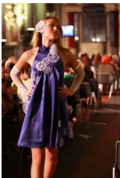
写真16 本学学生の作品