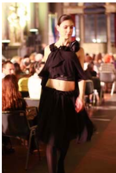
写真17 本学学生の作品