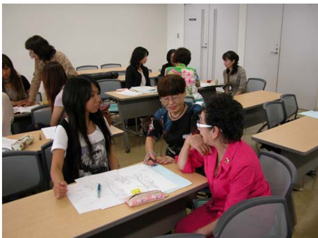
写真1 第1回指導会の様子(1) デザイン画を見ながら、パターンメイキングや素材の検討をする学生とNDK会員デザイナー