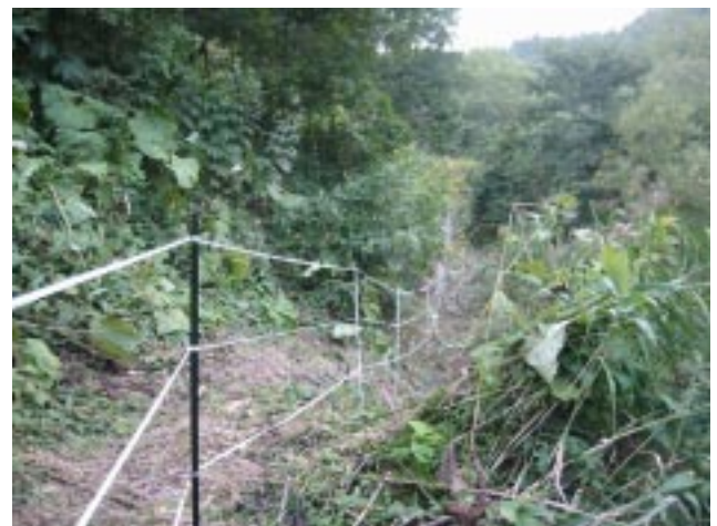
図8 放牧実験地（約1.5 ha）を囲む電気牧柵の設置