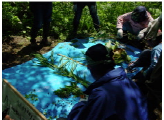
図12、13 コドラートを使った植物調査