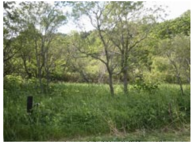
図7 2006年の里山実験地の放牧前の景観

4月22日当別町への移住田園住宅居住者も参加しての打ち合わせ会議で里山づくりの取り組みの事業を紹介する。田園住宅居住者からもプロジェクトに参加したい希望者が現れる。