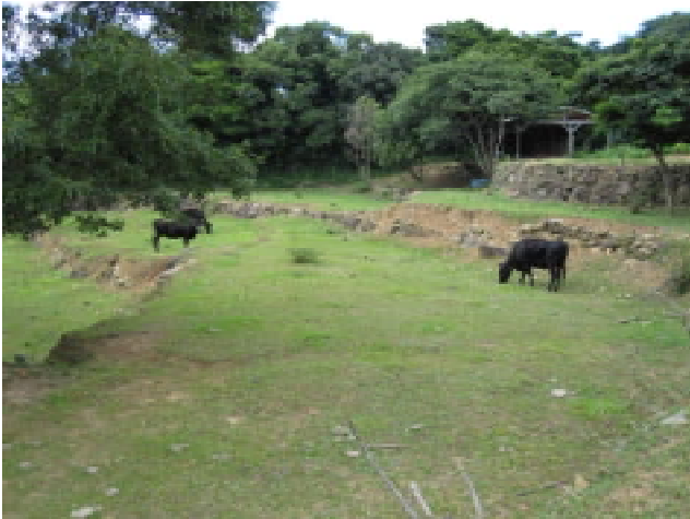
図21 山口型放牧の実施地 石垣が元棚田であったことを物語る

専門家であるが、移動型放牧に着目する中で、その一石二鳥（耕作放棄地の活用・景観向上・牛の飼育等の多くの効用）の有用性に大きく目を開かれたそうである。午後、長門市の山口型放牧地の実施地の見学に赴く。最初の見学地は、油谷町の棚田が段々状の牧野になっており、牛が放牧され草をはむ風景と油谷湾の景観が素晴らしい。二番目は水岬のちかく放牧事例。周辺は耕作放棄された棚田が荒れ深い藪になる中、牛の放牧で2.4haの棚田の形状が現れ、草地となった見事な景観である。三番目は日本海を望む一角、山口型放牧発祥の場所で海と棚田の景観が素晴らしい。大型家畜を活用した環境づくりの取組であること、めざすべき景観等、共通するものがあり大変興味深い事例調査であり、今回の研究実践のめざすべき方向への新たな自信にもつながるものであった。