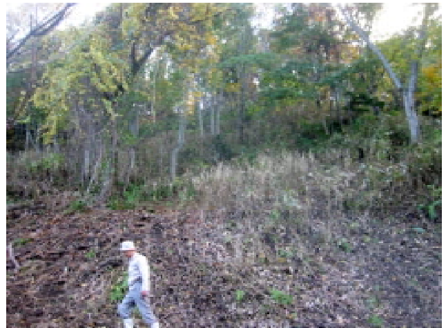
図18 里山林内の斜面地の下草の変容