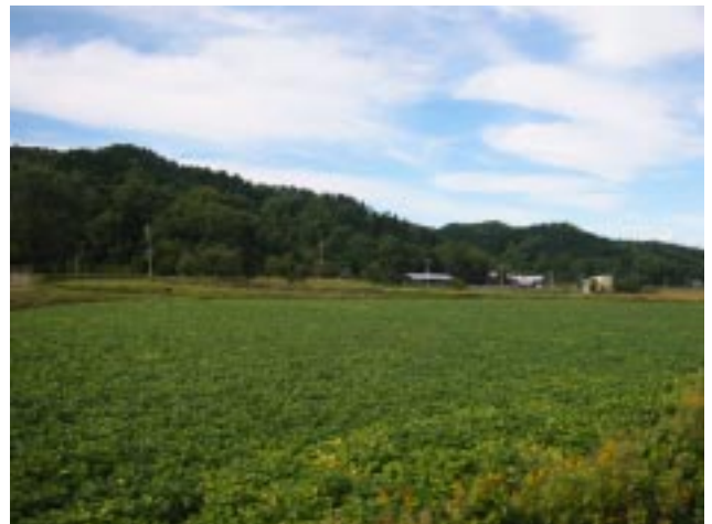
図1 実験地の里山景観－山裾に見えるのは田園住宅群

研究フィールドとしては筆者らがここ10年来、田園住宅づくりプロジェクトで係わってきた北海道当別町金沢地区の里山を対象とした。フィールドは農地の広がる石狩平野の北縁にあり、丘高80～100m長さ数km、南東向きの斜面で、面積約500haで当別町の町有林である。広葉樹と植林した松などがモザイク状に拡がり、景観的には美しいが、林内は人の背丈ほどもあるクマイ笹の下草でびっしり覆われ、初夏から秋にかけては林内に入っていくことも難しい