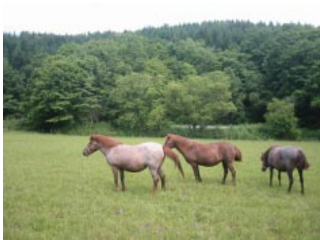
図6 2005年の実験では牧場内にいることが多かった放牧馬

実験地の牧場に到着。まずは牧場の草地にいれ、すこしづつ慣らして、林間放牧のスペースに誘導していく計画であった。