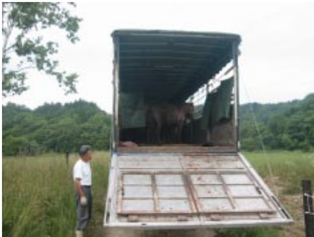
図5 当別町の里山放牧実験地に道産子馬の到着