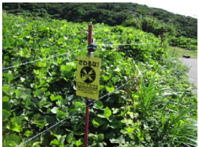
図20 山口型放牧の実施予定地の放牧前の状況 雑草が繁茂する耕作放棄棚田の周囲に電気牧柵が設置されている