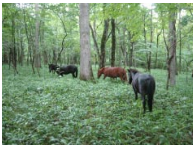
図4 北大静内牧場内の道産子馬の林内放牧

5月22日静内北大農場に秦准教授を訪問。農場内の蹄耕法の草地を見る。林間放牧の場所とそうでない場所の比較