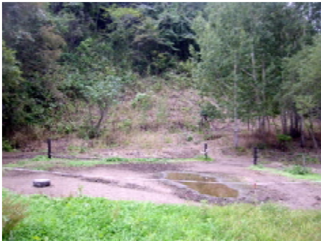
図15 放牧後2ヶ月の里山林内の変容

放牧後、2ヶ月の里山変容。電気牧柵内はまったく下草が消滅している（図15）。図15,16の白いラインが林間放牧地