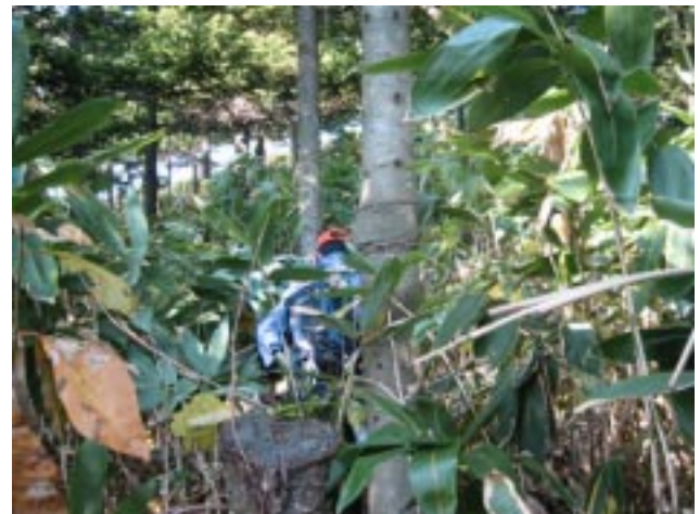
図2 人の背丈ほどのクマイ笹の繁茂する里山の林内