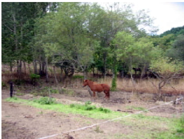
図16 放牧後2ヶ月の里山林内と道産子馬