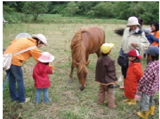
図14 子供達の放牧馬に近づいて観察

7月10日に第2回馬がつくる里山の自然環境調査を実施する。10時～15時。参加者12名。子供たちも参加して、