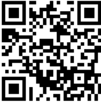
↑ 日本スノーボード教程の情報