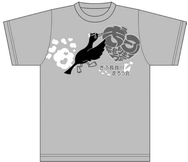
図 3.ぎふ長良川走ろう会オリジナルTシャツデザイン原案 (デザイン：塩田典子)

作した。健康志向の高まる現代において、主に若年層への同会のイメージ訴求を目的として定め、制作に取り組んだ。参加学生 15 名の提案の中から最優秀案を選び、実際に使用する T シャツのデザイン原案 (図 3) として採用した。