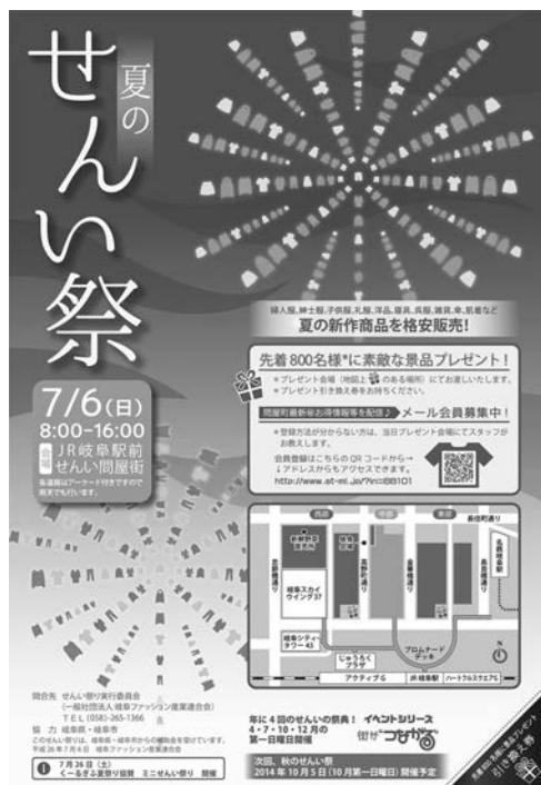
図 2.せいんい祭 広報メディア (デザイン：久野そらん)